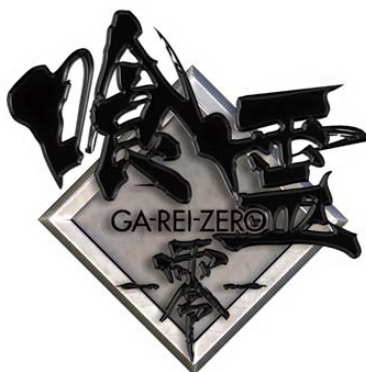
PA喰霊-零- 葵上 ~あおいのうえ~ 設定付

当社はこのたび、新規則に対応したパチンコ遊技機第3弾としまして『PA喰霊 -零- 葵上 ~あおいのうえ~ 設定付』を発売することになりましたので、お知らせいたします。全国のパチンコホール様には、平成30年10月中旬から導入予定です。