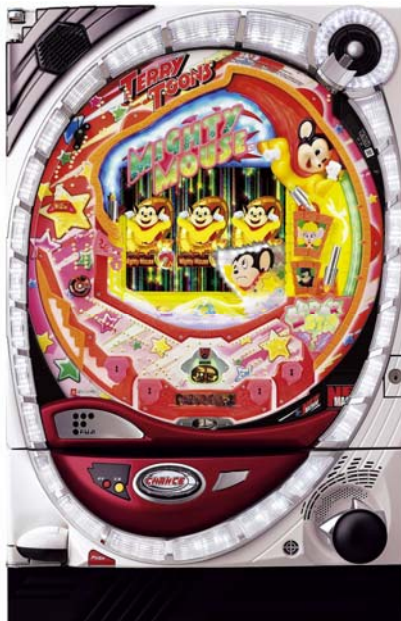
CRテリーテューンズマイティマウス